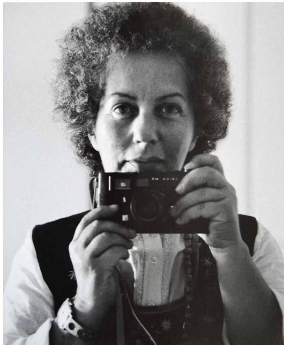
Lisetta Carmi, Autoritratto, 1974, © Martini & Ronchetti, courtesy archivio Lisetta Carmi

In occasione dei cento anni dalla nascita di Lisetta Carmi, Palazzo Ducale presenta una grande mostra dell'artista e fotografa genovese, che nel corso della sua vita ha avuto il coraggio di percorrere vie diverse dando sempre voce agli ultimi. Un viaggio che parte da Genova e dall'Italia per raccontare, con il suo sguardo acuto e lucido, realtà lontane e mondi in trasformazione, con inedite immagini a colori che affiancano le serie più famose in bianco e nero. In mostra le immagini della serie dei travestiti degli anni Sessanta, pubblicate nel 1972 suscitando scalpore e segnando le ricerche fotografiche di molti artisti internazionali, e la serie inedita Erotismo e autoritarismo a Staglieno , in cui il monumentale cimitero genovese si trasforma, sotto l'obiettivo della fotografa, in un ritratto della società borghese ottocentesca e dell'erotismo associato ai monumenti funebri. La città di Genova emerge anche in altre sfaccettature inaspettate, col racconto del mondo del lavoro nelle famose immagini del porto di Genova e dell'Italsider ma anche in quelle, in parte inedite, dell'Anagrafe e degli aspetti della vita culturale e sociale della città.