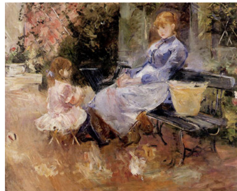
Berthe Morisot, La favola , 1883 Olio su tela, 65 x 81 cm Collezione privata, CMR 139

Scuola infanzia e primo ciclo scuola primaria