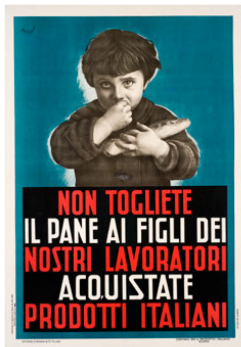
Mario Roveroni. Acquistate prodotti italiani!, 1935 ca., stampa litografica a colori, Wolfsoniana - Palazzo Ducale Fondazione per la Cultura, Genova, GE1933.2:159

Secondo ciclo della scuola primaria, secondaria di I e di II grado